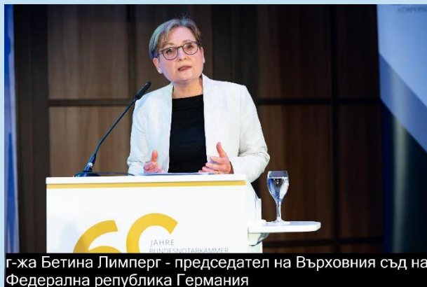
г-жа Бетина Лимперг - председател на Върховния съд на Федерална република Германия

Основната реч на събитието бе изнесена от г-жа Бетина Лимперг в качеството ѝ на председател на Федералния върховен съд. Тя започна със сентенция на Сенека, която гласи: “Човешко е да се греши: да се продължава (да се греши) е дяволско”. Според г-жа Лимперг нотариалната професия е обвързана с една абсолютна надеждност и неутралност. Именно удостоверяването на строги формалности гарантира за доверието в професията и правната защита на гражданите. Именно в този контекст Председателят на Федералния върховен съд подчерта, че с навлизането на новите технологии неминуемо и идва рискът от напълно дигитализиране на човешката професия. Според г-жа Лимперг в основата на върховенството на закона е правото на гражданите да получават правосъдие от държавата. Именно нотариусите играят важна роля в борбата за справедливост, тъй като тяхната професия е пожизнена. Председателят на Федералния