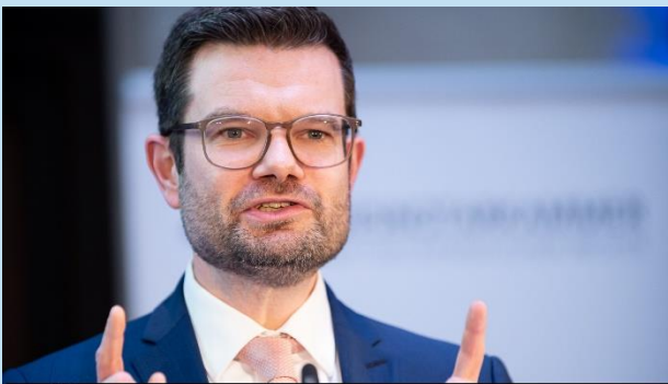
д-р Марко Бушман - министър на правосъдието на Федерална република Германия

Г-н Бушман сподели своето виждане, че Bundesnotarkammer винаги е била движеща сила за проекти в областта на дигитализацията (например разработване на прототип на блокчейн