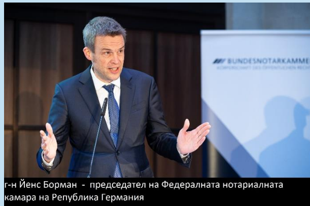
г-н Йенс Борман - председател на Федералната нотариалната камара на Република Германия

Събитието бе открито с реч на председателя проф. д-р Йенс Борман, който накратко разказа историята на създаването на немския нотариат. Bundesnotarkammer е основан през 1961 г. посредством изменения на вече съществуващия нотариален кодекс в резултат на 10-годишни дискусии със статут на „чадърна“ организация на немските нотариуси. Федералната нотариална камара на Германия се счита за самоуправляващ се публичен орган със суверенни права и задължения, но и за професионално представителство за всички нотариуси