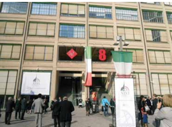
Конгресният център Линко

директива в частта си, касаеща нотариусите, да не се променя.