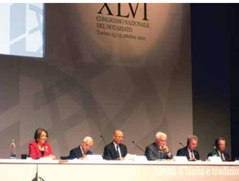
Ръководителите на италианския нотариат и конгреса

В периода 12–15 октомври в Турино се състоя 46-ият конгрес на италианския нотариат. Той бе посветен на 150-годишнината от обединението на Италия и се проведе под наслов „Обединението на Италия и нотариалната традиция“.