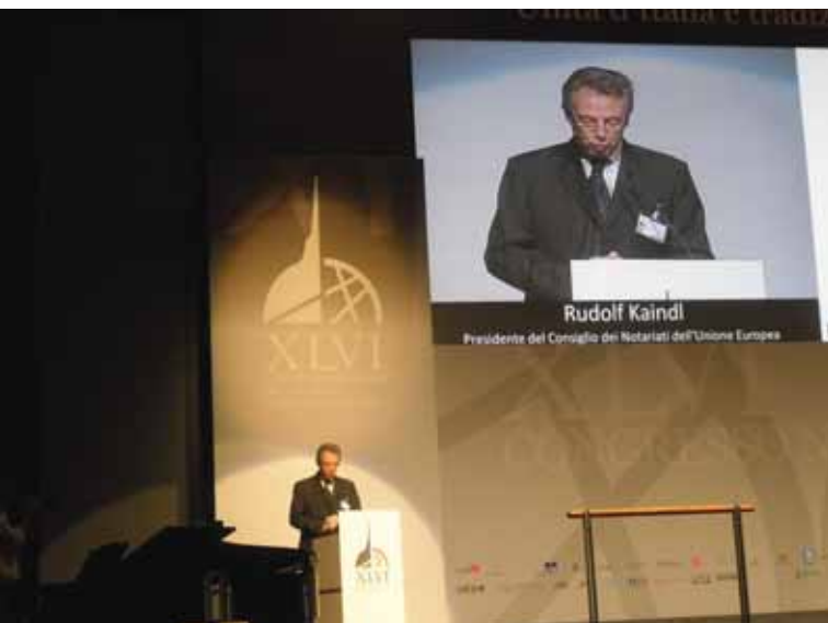
Рудолф Кайндл, председател на Съвета на Нотариатите от Европейския съюз