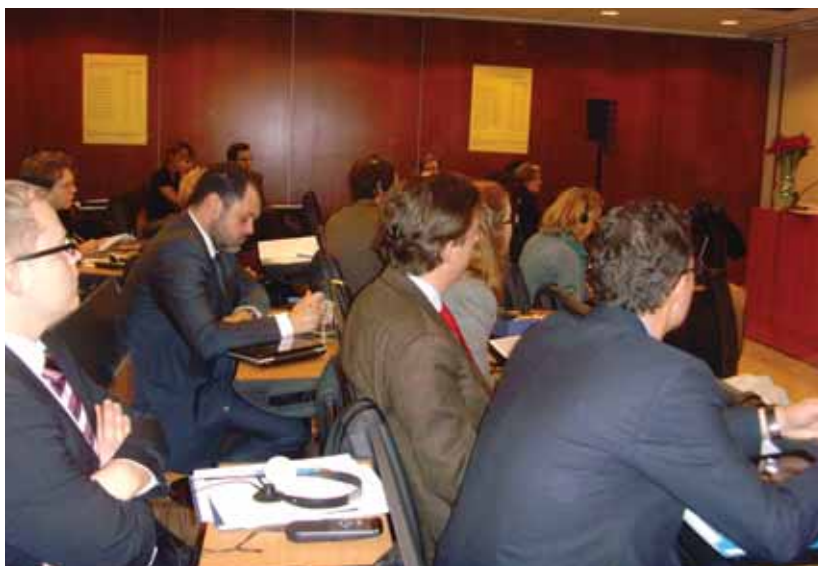
Пленарна зала по време на работната среща на семинара