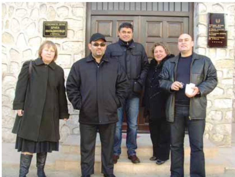
Представителите на Нотариалната камара на Република България пред дома на братя Миладинови в град Струица, където ежегодно се провеждат литературни празници и се връчва лавров венец, включително такъв е връчен и на българския поет Любомир Левчев

на. Такъв регистър има в Холандия, Чехия, Словения, Черна гора.