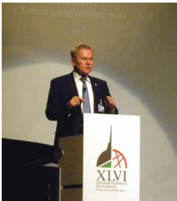
Жан-Пол Декор, председател на Международния съюз на нотариата

ментирани професии, като юридическата, медицинската или такива в услуга на гражданите. Би било опасно систематично да се либерализират тези професии, като се оставя свободно поле за дива конкуренция, където всички удари са позволени, т.е. на закона на джунглата, на закона на по-силния, по-хитрия или по-богатия.